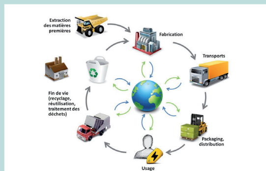
Figure 1 : L'ACV d'un produit/service : une évaluation de tous les impacts environnementaux, de l'extraction des matières premières jusqu'à la fin de vie

L'Analyse du Cycle de Vie (ACV), dont le cadre est normalisé (ISO 14 044), est une méthode d'évaluation environnementale largement employée dans le monde industriel. À ce jour c'est la seule méthode d'évaluation capable de quantifier les impacts sur l'ensemble du cycle de vie d'un système (produit, service ou procédé), depuis l'extraction des matières premières en passant par l'exploitation du système et jusqu'à sa fin de vie. Par son approche multicritère, elle permet d'identifier les principales sources d'impacts environnementaux et d'éviter ainsi les transferts de pollution d'une catégorie d'impact à une autre ou d'une étape du cycle de vie à une autre.